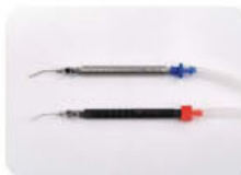
Irr/Asp Canula Handpiece