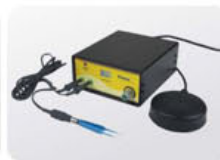
Digital Bipolar Coagulators