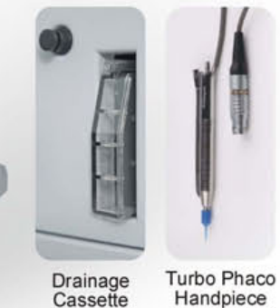
Drainage Cassette Turbo Phaco Handpiece