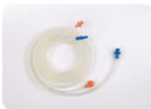
Venturi Fluidics Set