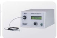
LED Cold Light Source